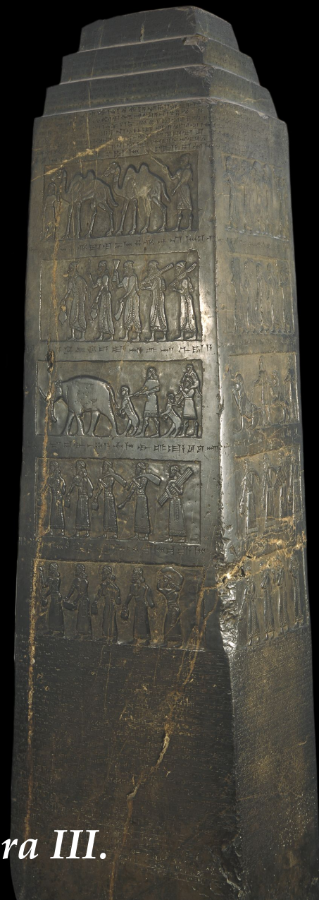
Černý obelisk asyrského krále Salmanassara III.