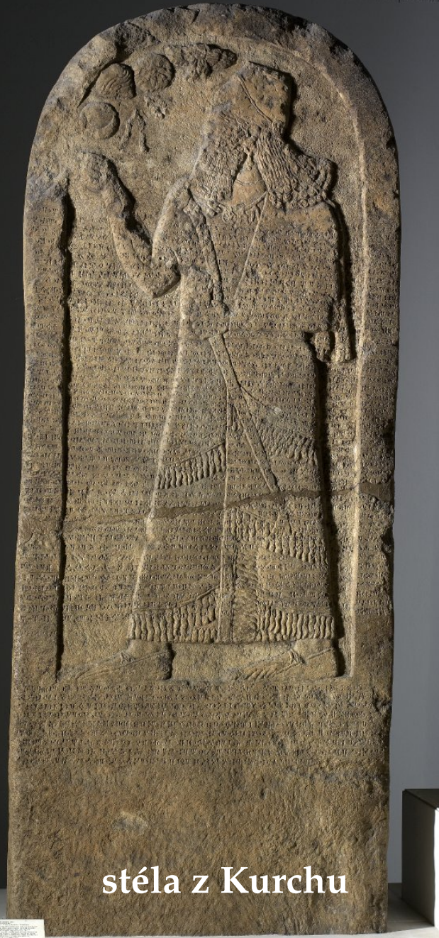
stéla z Kurchu