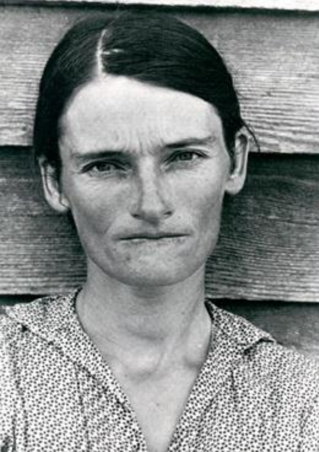
Sherrie Levine (After Walker Evans) Ink jet print, 10.5 x 7.5", 2001