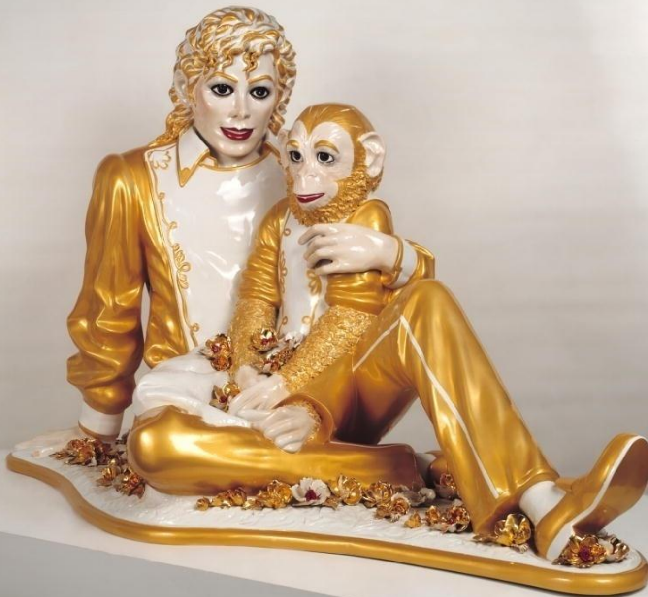
Jeff Koons, Michael Jackson s opicí, 1988.