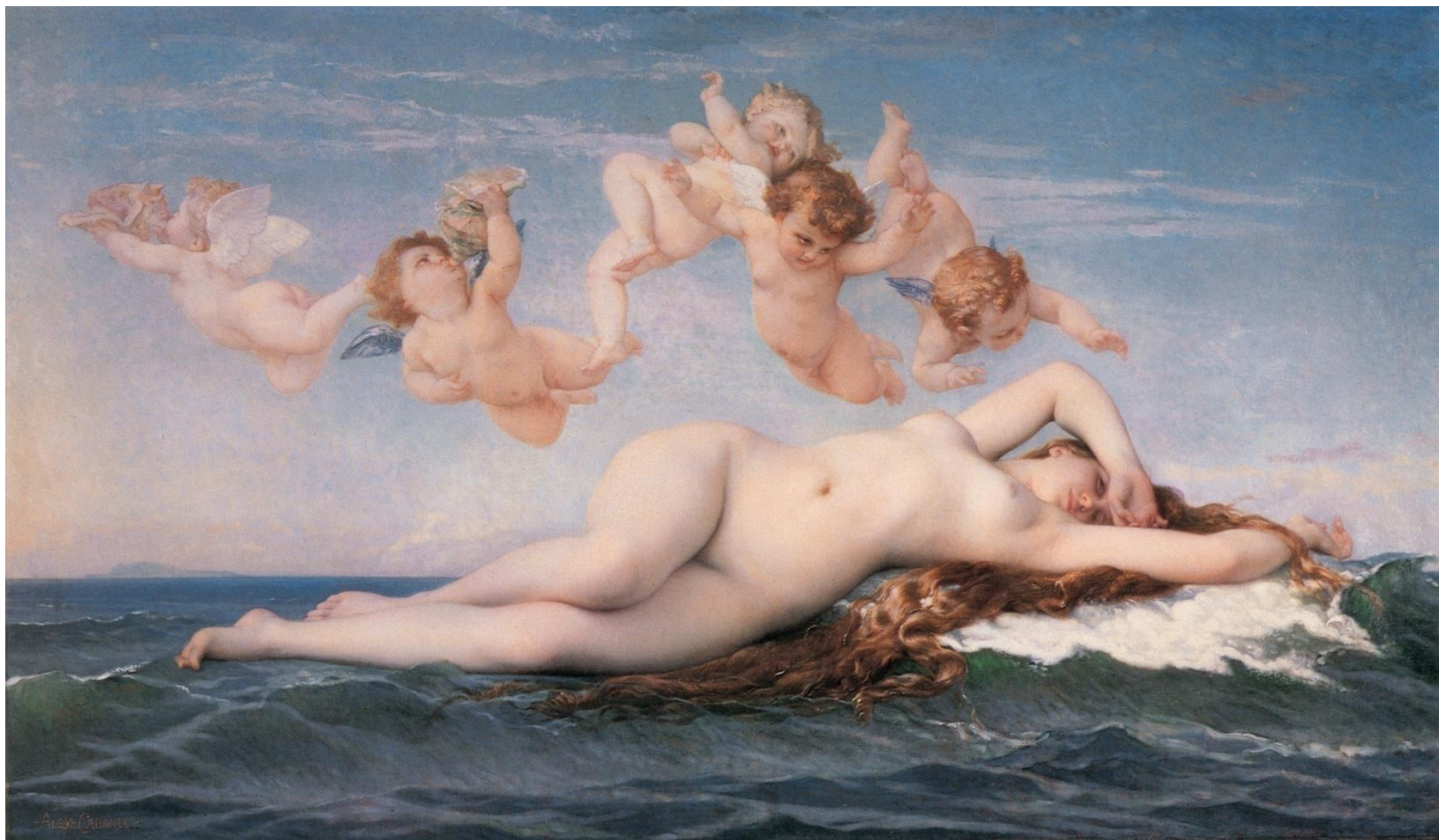
Alexandre Cabanel, Zrození Venuše , 1863