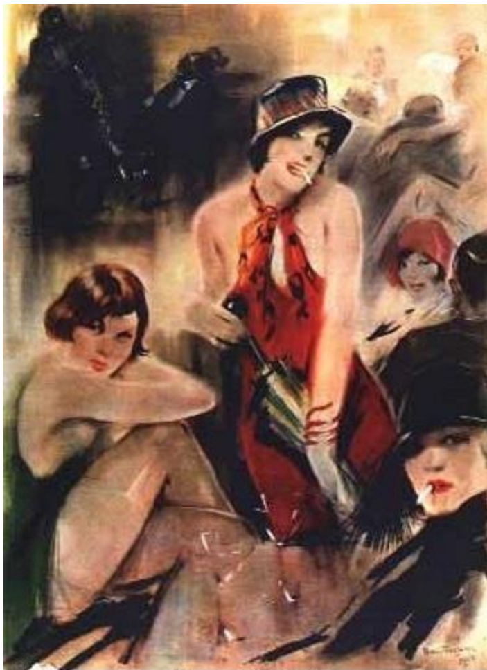
Han van Meegeren Nachtlokaal # 2, Original ca. 1925, Private Collection