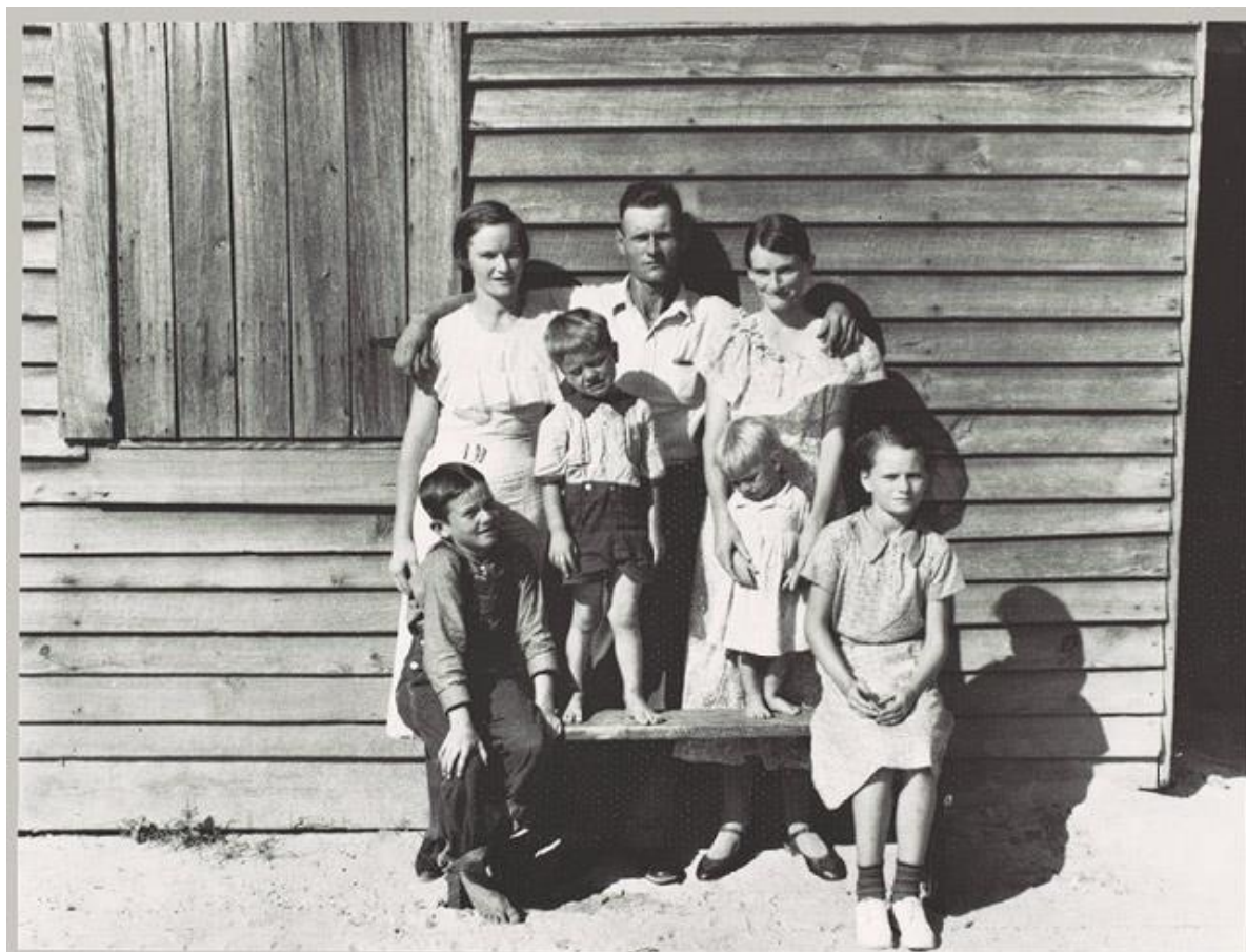
After (podle) Walker Evans: 2, 1981 Sherrie Levine (American, born 1947) Gelatin silver print; 3 3/4 x 5 1/16 in. (9.6 x 12.8 cm) Gift of the artist, 1995 (1995.266.2)